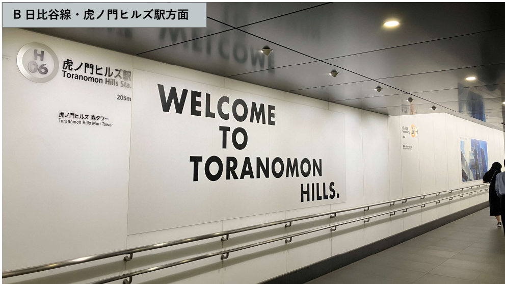
B 日比谷線・虎ノ門ヒルズ駅方面