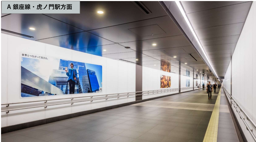
A 銀座線・虎ノ門駅方面