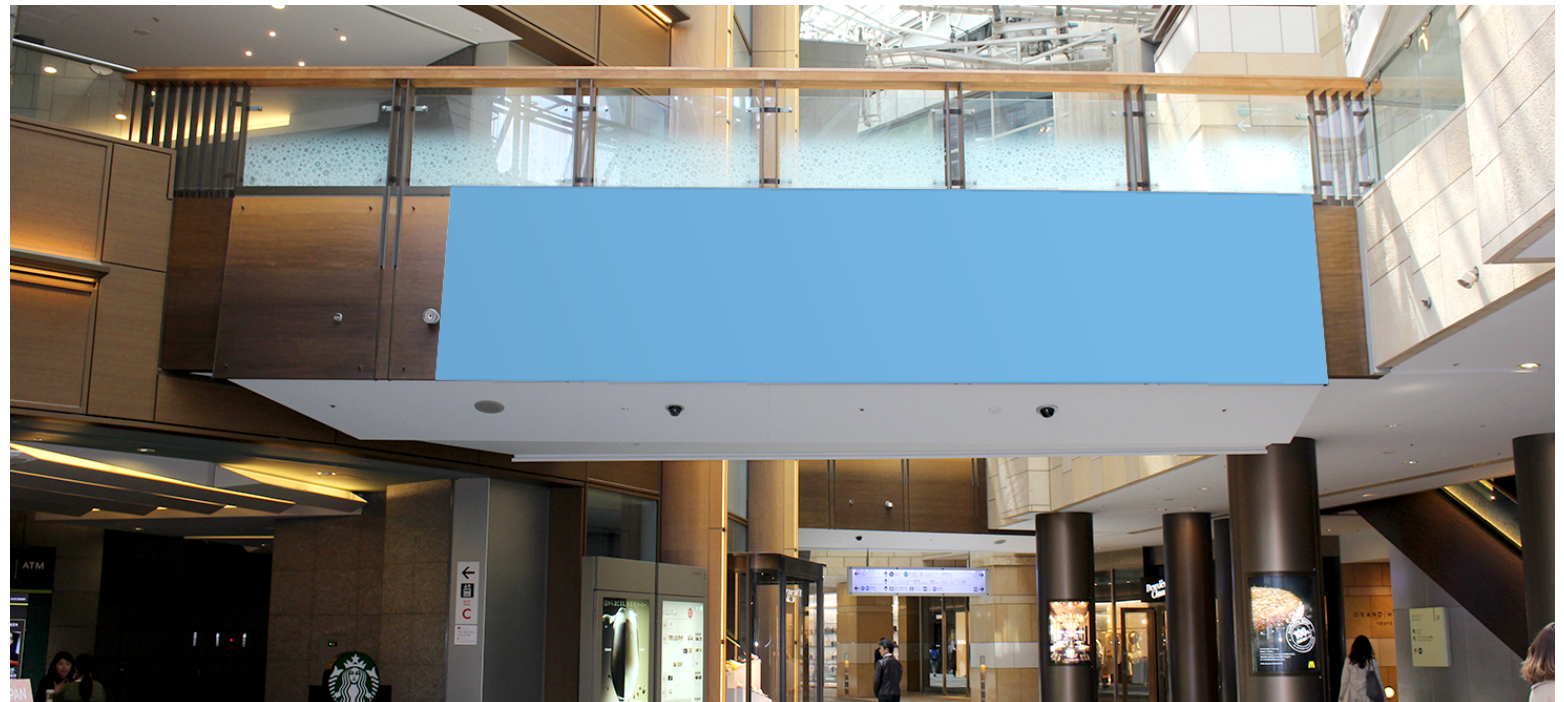
▲北側3Fブリッジ側面