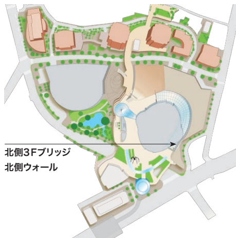
北側3Fブリッジ 北側ウォール