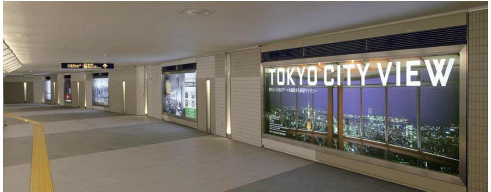
▲地下鉄コンコース